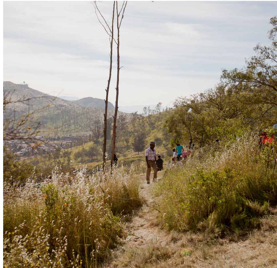
Cerro Renca

Cada cerro reúne gran variedad de actores que deben dialogar en el desarrollo de todo "cerro parque natural". Las distintas divisiones del gobierno central, regional y local, más los propietarios del suelo, organizaciones civiles, ciudadanía y desarrolladores inmobiliarios deben involucrarse y alinearse para crear proyectos íntegros, sustentables y no cortoplacistas. Es fundamental explorar