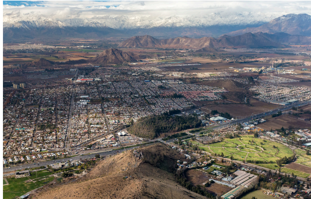
Cerro Hasbún desde el Cerro Chena.

La infraestructura debiera ser la mínima necesaria para fomentar su uso, y generar un espacio seguro para todos sus usuarios. Una suma de intervenciones mínimas puede contribuir a la consolidación de mayor cantidad de parques de mayor tamaño y con menos recursos, y otorgar cierta libertad para su uso. Creemos que bajar los niveles de diseño podría aportar en el aumento y la distribución de las áreas verdes en la ciudad.