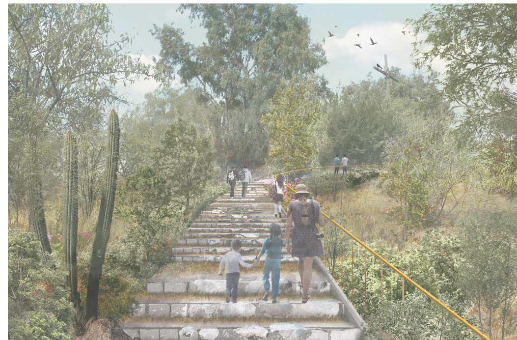
Inferior Sendero cima, Cerro Los Almendros Imagen: Fundación Cerros Isla, 2019.