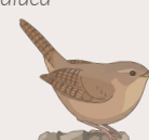
Chercan Troglodytes musculus