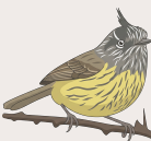
Cachudito Anairetes parulus