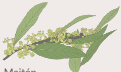
Maitén Maytenus boaria