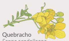
Quebracho Senna candolleana