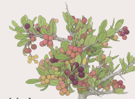
Huigan Schinus polygamus