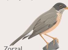
Zorzal Turdus falcklandii