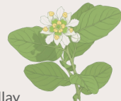
Quillay Quillaja saponaria