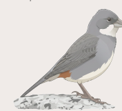
Diuca Diuca diuca