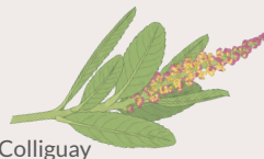
Colliguay Colliguaja odorifera