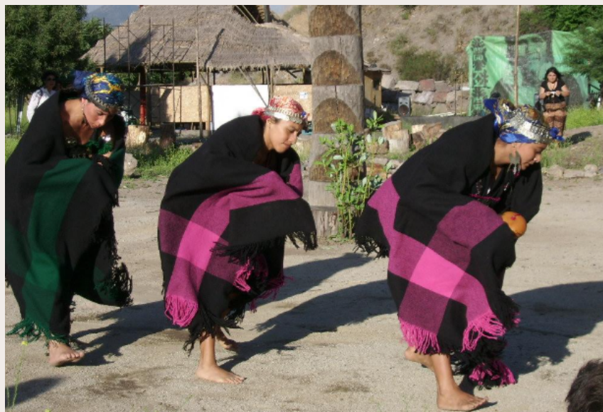
Bailando alrededor del Rehue del Apu Huechuraba. Aldea de la Paz, Cerro Blanco.

Entre 1991 y 1992, en el contexto de las movilizaciones por los 500 años de la conquista, surgió un incipiente interés en torno a reivindicaciones culturales y políticas de los pueblos originarios. Grupos como Manca Saya, Arac Pacha e Illapu formaron parte de este impulso. Es en ese contexto que emerge la Coordinadora Nacional Indianista (CONACIN), organización que aglutinaba a personas Rapa Nui, Aymara, Mapuche y chilenas de más de una veintena de comunidades.