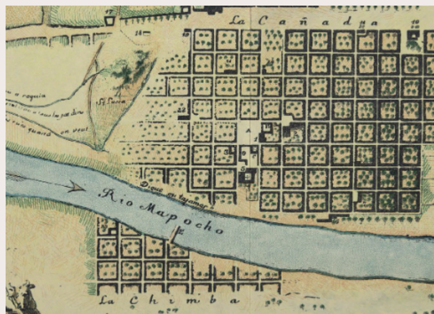
La Chimba en Plan de la Ville de Santiago. Mapa de Santiago de Chile durante el siglo XVIII. François Frezier / Jacques N. Bellin.