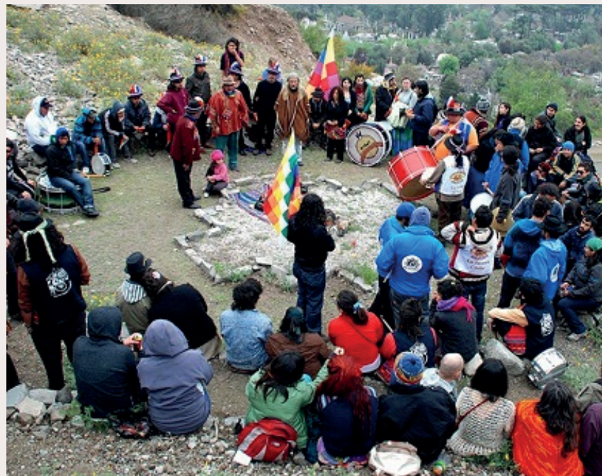
CONACIN · Aldea de la Paz, Altar Mayor. Ceremonia en el Cerro Blanco.

«Han sido 5 años de lucha para recuperar el Cerro Blanco como Centro Ceremonial y otros 16 años de trabajo y esfuerzo para sostener y gestionar los diferentes espacios.» — Concejo de Defensa del Apu Wechuraba, octubre de 2016.