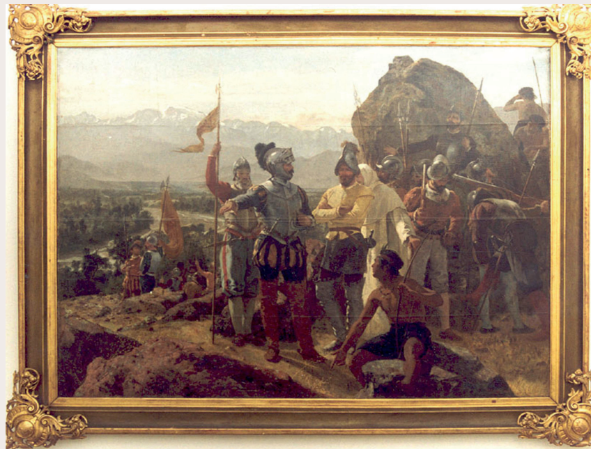
La fundación de Santiago. Pedro Lira, 1888. Óleo sobre tela.

La llegada de los españoles al sector implicó la expulsión y redistribución de gran parte de la población