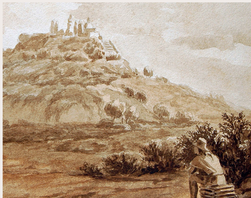
La fundación de Santiago. Pedro Lira, 1888. Óleo sobre tela.

En 1645, el Cabildo de Santiago sesionó para elegir virgen patrona de la ciudad. Se deliberó entre tres figuras votivas: la Virgen del Socorro (franciscanos), supuestamente traída por Valdivia y de gran devoción entre los conquistadores; la Virgen de las Mercedes (mercedarios), conocida como «la Antigua»; y la Virgen del Rosario o Montserrat, custodiada por la Orden de Predicadores. El solo hecho de que la ermita compitiera por ese honor confirma el peso simbólico que aún conservaba un siglo después de su fundación.