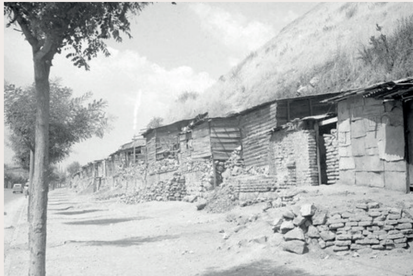
Población de canteros en Cerro Blanco por Av. Recoleta.

«En las canteras abandonadas del Cerro Blanco y en los lugares que pueden presentar amparo para el frío nocturno, se habían refugiado alrededor de 500 cesantes [...] Durante las visitas practicadas, se pudo constatar la forma desaseada y miserable en que allí se vivía, al mismo tiempo que la promiscuidad vergonzosa que se llevaba en la vida de aquella colectividad.»